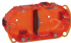
0 801 22