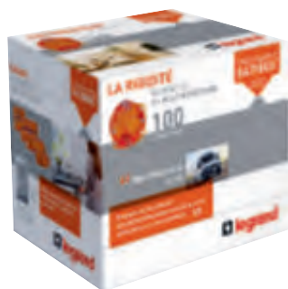
0 801 15