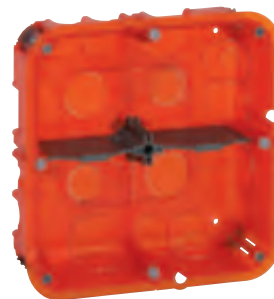
0 801 24