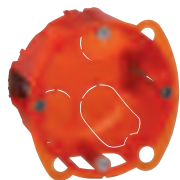
0 801 01